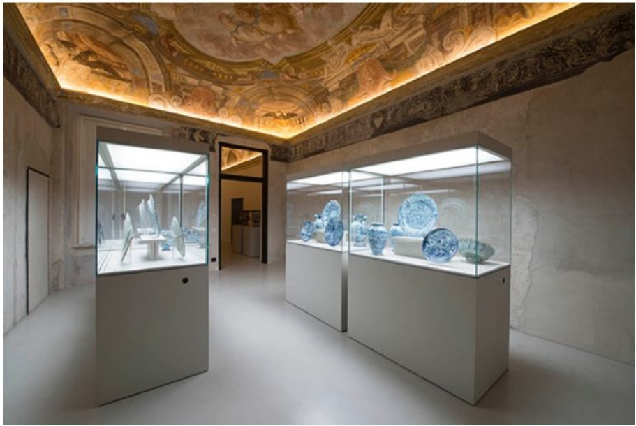
Inaugurazione: martedì 16 dicembre ore 17.00 Ingresso gratuito fino al 6 gennaio 2015

Home | Eventi | NASCE A SAVONA IL MUSEO DELLA CERAMICA