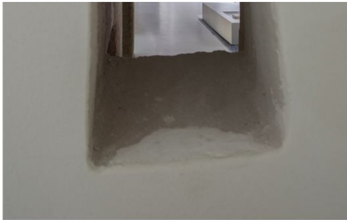
Vedi Scheda Progetto