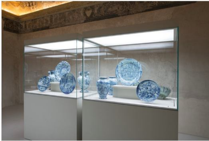
Vedi Scheda Progetto