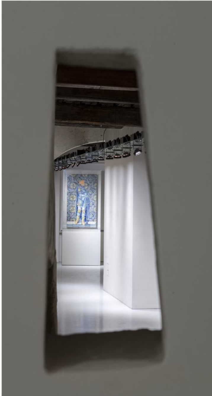
Vedi Scheda Progetto