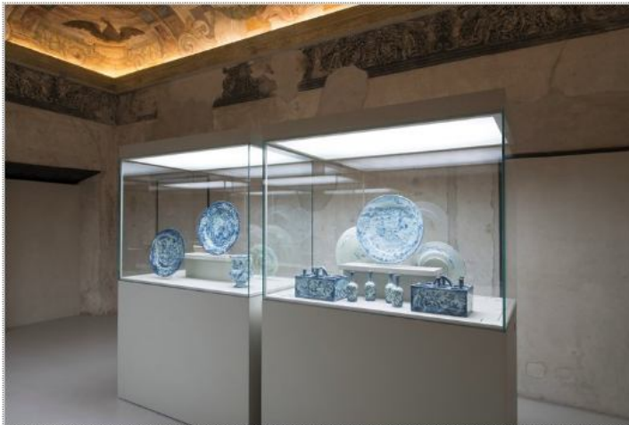
Vedi Scheda Progetto