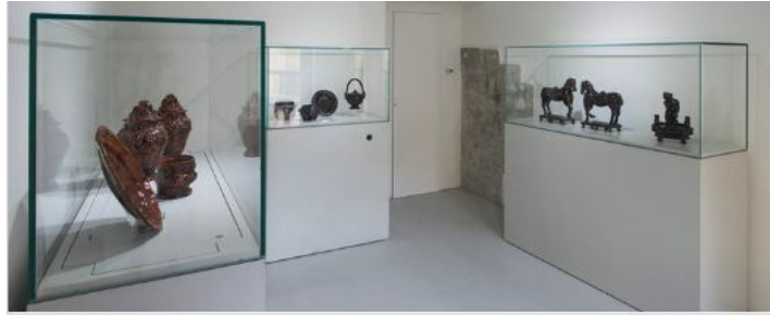
Vedi Scheda Progetto