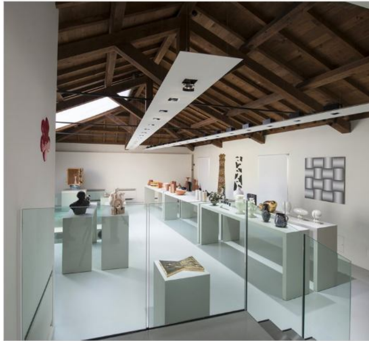
Vedi Scheda Progetto