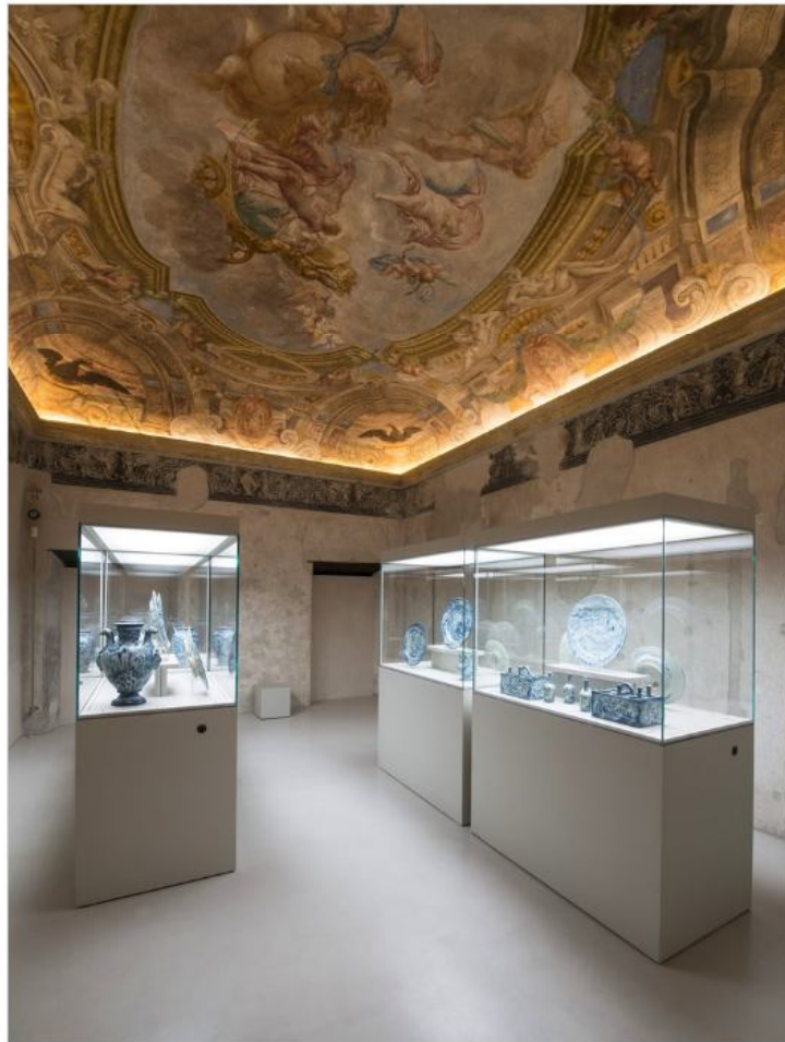
Vedi Scheda Progetto