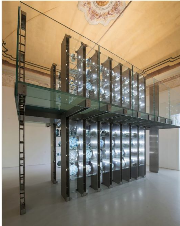
Vedi Scheda Progetto