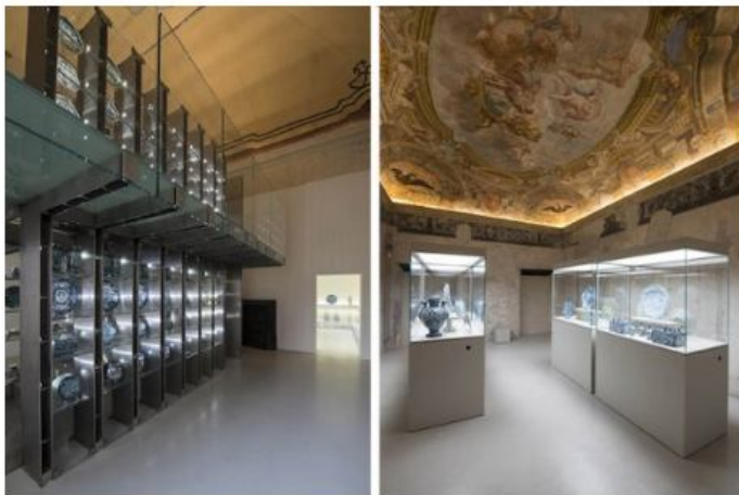
La struttura in vetro - acciaio studiata per allestire le ceramiche della Collezione Boncompagni Ludovisi e la seconda sala espositiva

Grazie all'impegno ed alla collaborazione tra Fondazione A. De Mari e Comune di Savona , il centro storico della città ha, oggi, un nuovo gioiello d'arte e cultura: il Museo della Ceramica , la cui realizzazione è stata fortemente attesa.