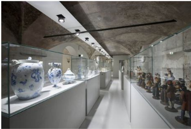
Opere del XIX secolo provenienti dalla donazione Folco e Presepe di Antonio Tambuscio

Nella rinnovata veste di Museo della Ceramica, gli spazi riqualificati e allestiti su quattro piani, vengono riaperti per la prima volta al pubblico e collegati direttamente, con questo intervento, all'adiacente Pinacoteca Civica. Quest'ultima, ospitata nell'edificio di Palazzo Gavotti, di proprietà del Comune, comprende straordinari dipinti antichi, tra cui la Crocifissione di Donato de' Bardi, e opere di celebri artisti contemporanei, come Picasso, Fontana, De Chirico, Magritte e Mirò, presenti nella collezione della Fondazione Museo di Arte Contemporanea Milena Milani in Memoria di Carlo Cardazzo. L'unione delle due realtà museali offre, così, slancio nella realizzazione di un importante e nuovo polo culturale per la città, il Museo d'Arte di Palazzo Gavotti, situato in un itinerario artistico unico, di rilievo internazionale, in stretto collegamento con le chiese e i palazzi del centro storico cittadino.