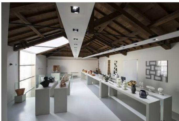
Opere d'arte contemporanea e di design del XXI secolo

Nel Museo trovano spazio le raccolte di proprietà della Pinacoteca Civica – l'antica vaseria dell'Ospedale San Paolo, la prestigiosa donazione del Principe Boncompagni Ludovisi e i pezzi donati o in deposito alla Pinacoteca a partire dal 2011 (raccolte Folco e Figliolia) – a cui si aggiungono le ceramiche acquistate nel tempo dalla Fondazione A. De Mari, come il corredo della farmacia Cavanna, la collezione Bixio e importanti opere provenienti dalle edizioni della Biennale della Ceramica, realizzate da noti artisti e designer contemporanei fra cui Michelangelo Pistoletto, Adrian Paci, Yona Friedman, Alberto Garutti, Ugo La Pietra, Alessandro Mendini, Andrea Branzi, Pekka Harni e Franco Raggi.