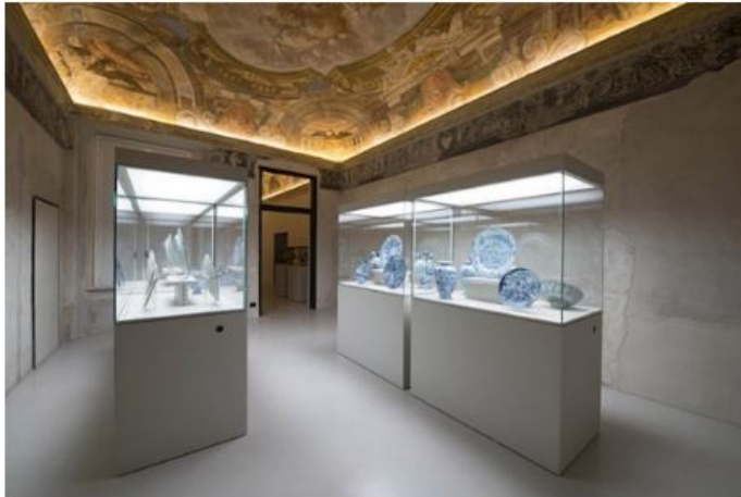
Il nuovo Museo della Ceramica di Savona

Grazie all'impegno ed alla collaborazione tra Fondazione A. De Mari e Comune di Savona , il centro storico della città ha, oggi, un nuovo gioiello d'arte e cultura: il Museo della Ceramica , la cui realizzazione è stata fortemente attesa.