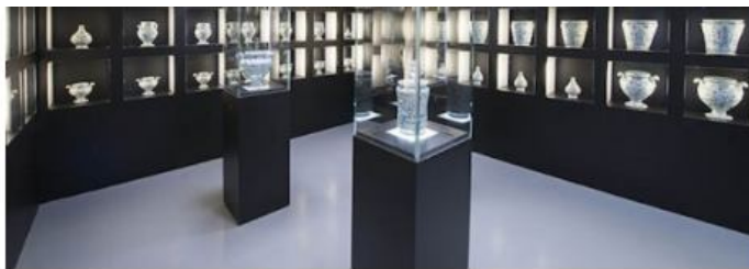
La collezione della farmacia dell'Ospedale San Paolo

Sede del Museo è il magnifico edificio quattrocentesco del Monte di Pietà – di proprietà della Fondazione A. De Mari – voluto, nel 1479, dal Papa savonese Sisto IV e restaurato dalla stessa Fondazione, con un intervento progettuale mirato da un lato a conservare e valorizzare le parti storiche preesistenti e, dall'altro, a favorirne una nuova fruibilità pubblica.