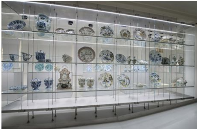
Il delicato allestimento in vetro realizzato per il museo

Sede del Museo è il magnifico edificio quattrocentesco del Monte di Pietà – di proprietà della Fondazione A. De Mari – voluto, nel 1479, dal Papa savonese Sisto IV e restaurato dalla stessa Fondazione, con un intervento progettuale mirato da un lato a conservare e valorizzare le parti storiche preesistenti e, dall'altro, a favorirne una nuova fruibilità pubblica.