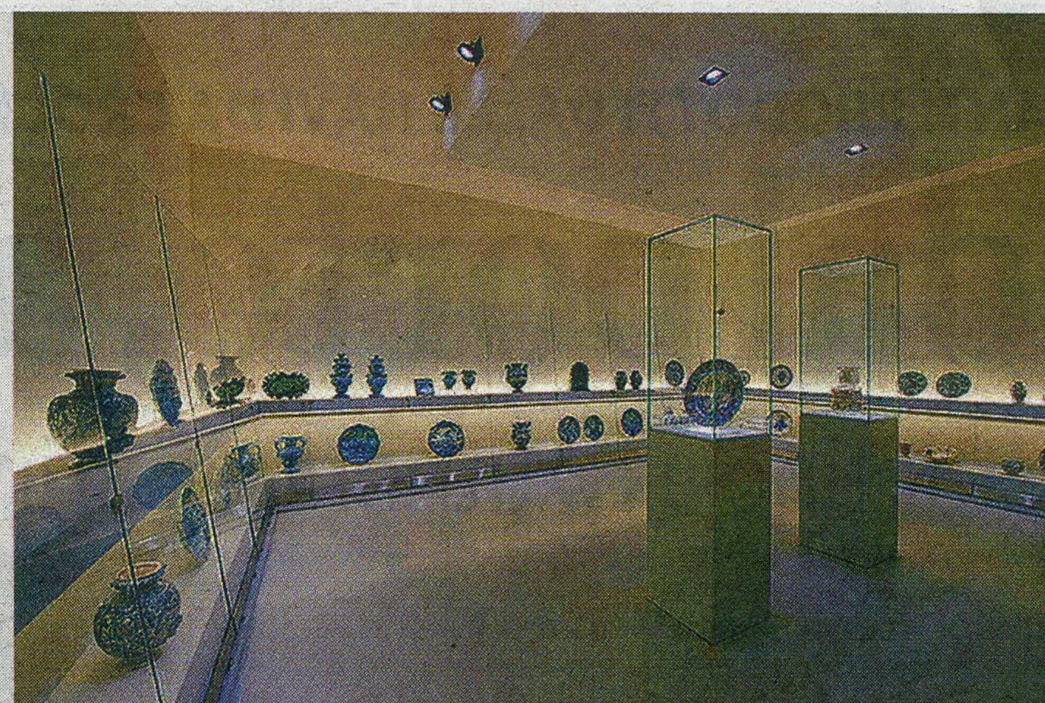
Una panoramica della grande vetrata che protegge i capolavori