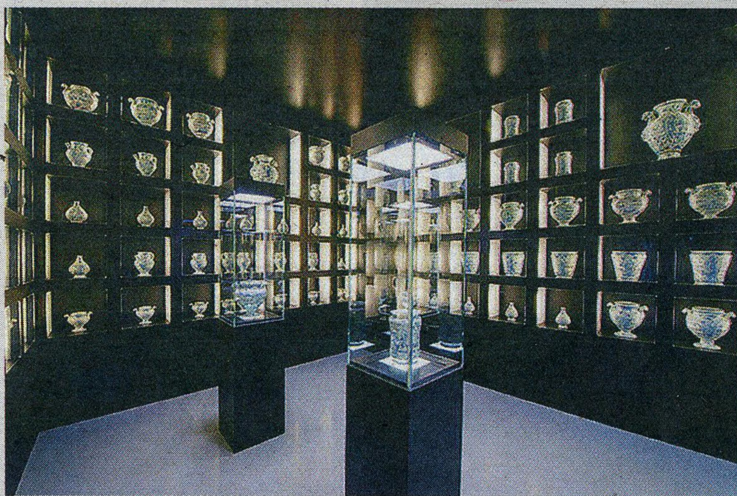
Le vetrine illuminate con i pezzi più pregiati della collezione